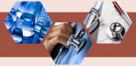
2006 年醫務委員會初步偵訊委員會的工作統計數字